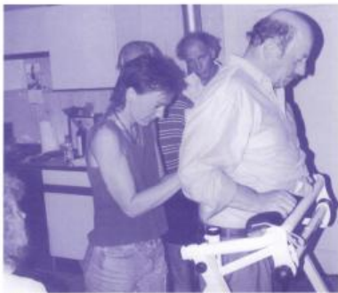
• Die Dorn-Methode ist nicht für Berechtigte sondern für Begabte. • D. Dorn