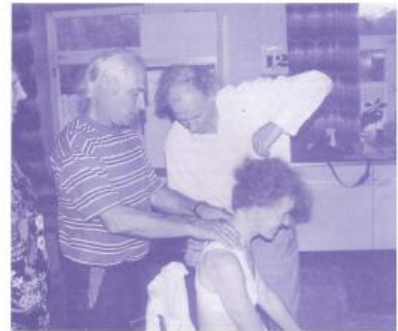
Abweichungen der Halswirbelsäule werden korrigiert, damit die Energie wieder frei fließt.