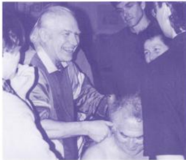
• Ehe man einen Herzschrittmacher reimacht, sollte man erst mal den zweiten Brustwirbel reimachen. • D. Dorn: Da ist nämlich oft die Steuerung des Herzes blockiert.