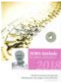
DORN-Methode bei Babys und Kinder