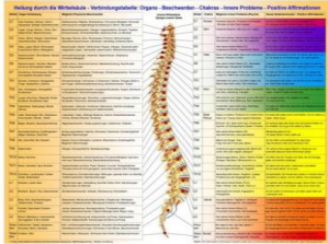
Heilung durch die Wirbelsäule

Sie finden das Poster von Thomas Zudrell bei uns im Sortiment: