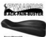
Spynamics Sacro Aligner™ - Die Kreuzbein-Schaukel

in dieser Rubrik können Sie auch die Kreuzbeinschaukel und die Rückenschaukel einzeln erwerben: