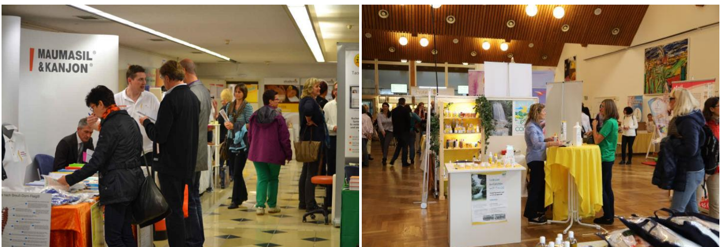
Aussteller und Besucher in regem Austausch.

Als Messebesucher begrüßen wir jährlich an Gesundheit interessierte Menschen, aber auch Therapeuten, Heilpraktiker, Ärzte und Schmerz Betroffene aus ganz Deutschland, welche durch die Vorträge und Workshops gern den DORN-Kongress besuchen und oft auch das ganze Wochenende vor Ort bleiben. Dies kommt den Ausstellern aus