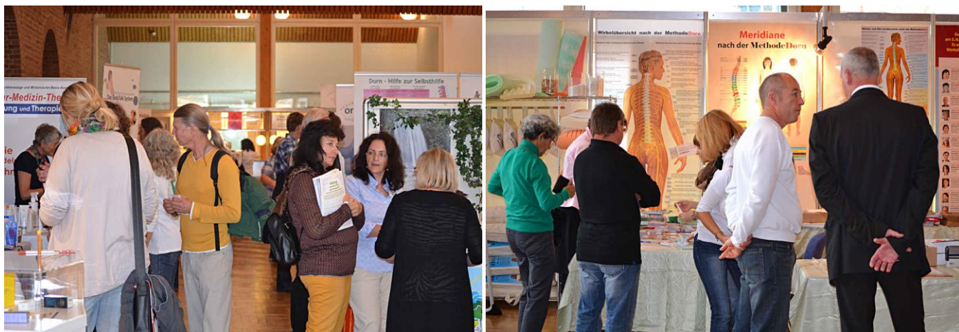
Ausstellung mit Besucher von Nah und Fern.

den Bereichen Gesundheit, Wellness, Fitness, Ernährung, Lebenshilfe u.v.m. stets zu Gute, da sie sich auch viel Zeit für Beratungen der Aussteller nehmen. In unserer frei zugänglichen Ausstellung können unsere Besucher staunen, sich informieren und Impulse für neue Wege vermittelt bekommen.