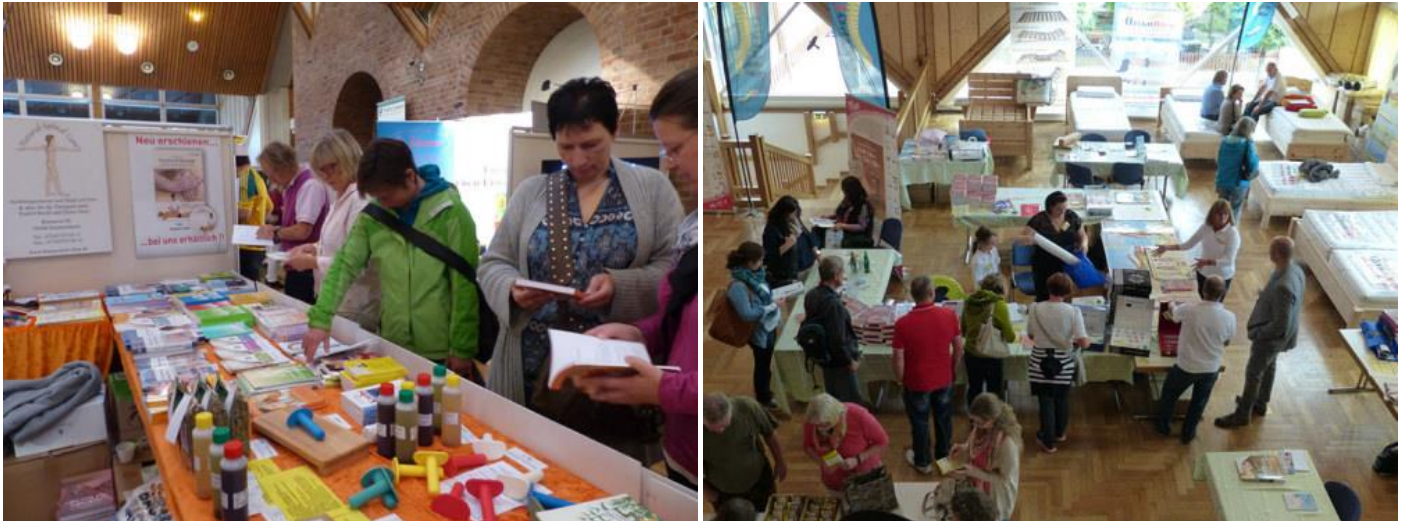
Aussteller auf dem DORN-Kongress präsentierten ihr Sortiment.

Haben Sie auch Interesse auf dem DORN-Kongress Ihre Produkte bzw. Dienstleistungen zu präsentieren? Dann melden Sie bitte Ihre Standplatzwünsche so schnell als möglich.