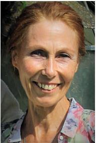
Monika Grießer Die NEUE Dunkelfeld-Mikroskopie nach HP Scheller